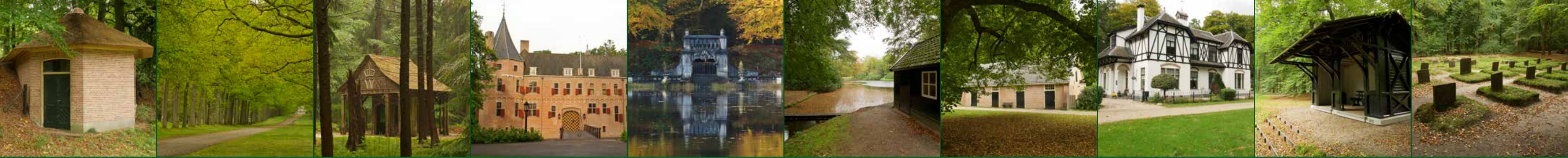
1. Ijskelder Ice House 2. Koningslaan King's Avenue 3. Willemstempel Willem Temple 4*. Het Oude Loo Het Oude Loo 5*. Beeldenvijver Statue Pond 6. Forellenvijver Trout Pond 7. Hondenhokken Kennels 8. Jagershof Hunting Lodge 9. Oude Schietbaan Old Shooting Range 10. Paardenkerkhof Horse Cemetery